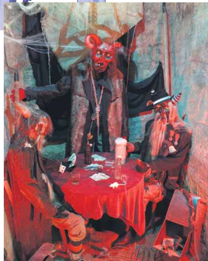
Krásně bát se budete také v Muzeu strašidel v Plzni, takto tam třeba vypadá zdejší peklo plné čertů.